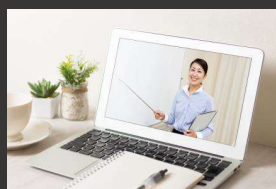
③ インストラクターへの質問

東京海上日動ベターライフサービス株式会社 介護事業者向けセミナー担当 東京都世田谷区用賀4-10-5 SBS ヒルズ4 https://www.tnbls.co.jp/solution/