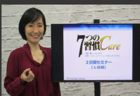
① オンライン研修体験