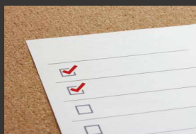
② 費用・日程の相談